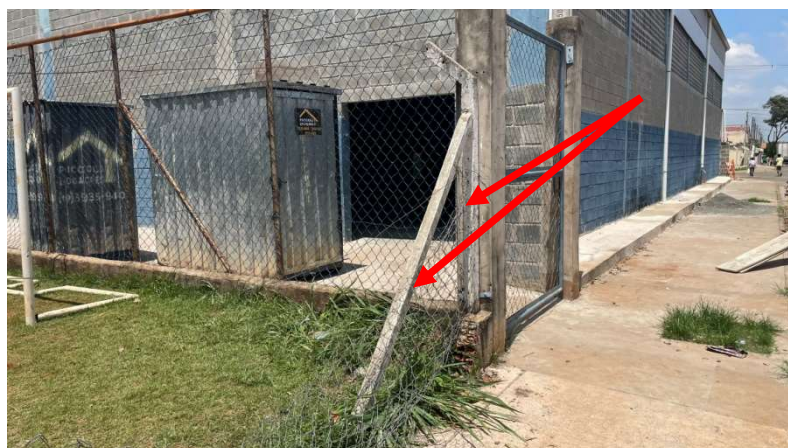
FOTO 2 - Vista dos mourão em concreto do alambrado a ser removido