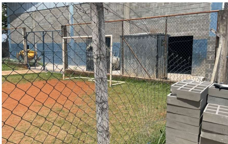
FOTO 1- Vista do trecho do alambrado que foi danificado

Deverão ser removidas as telas de alambrado do último trecho do fechamento lateral com a rua Dalila de Arruda Abdala, para demolição de pequeno trecho de muretas já quebradas conforme foto e remoção do mourão em concreto e seu tirante localizado na divisa com pilar em concreto. Todo material (entulho/restos) resultante da limpeza final da obra, deverão ser removidos e destinadas a um local definido pela fiscalização.