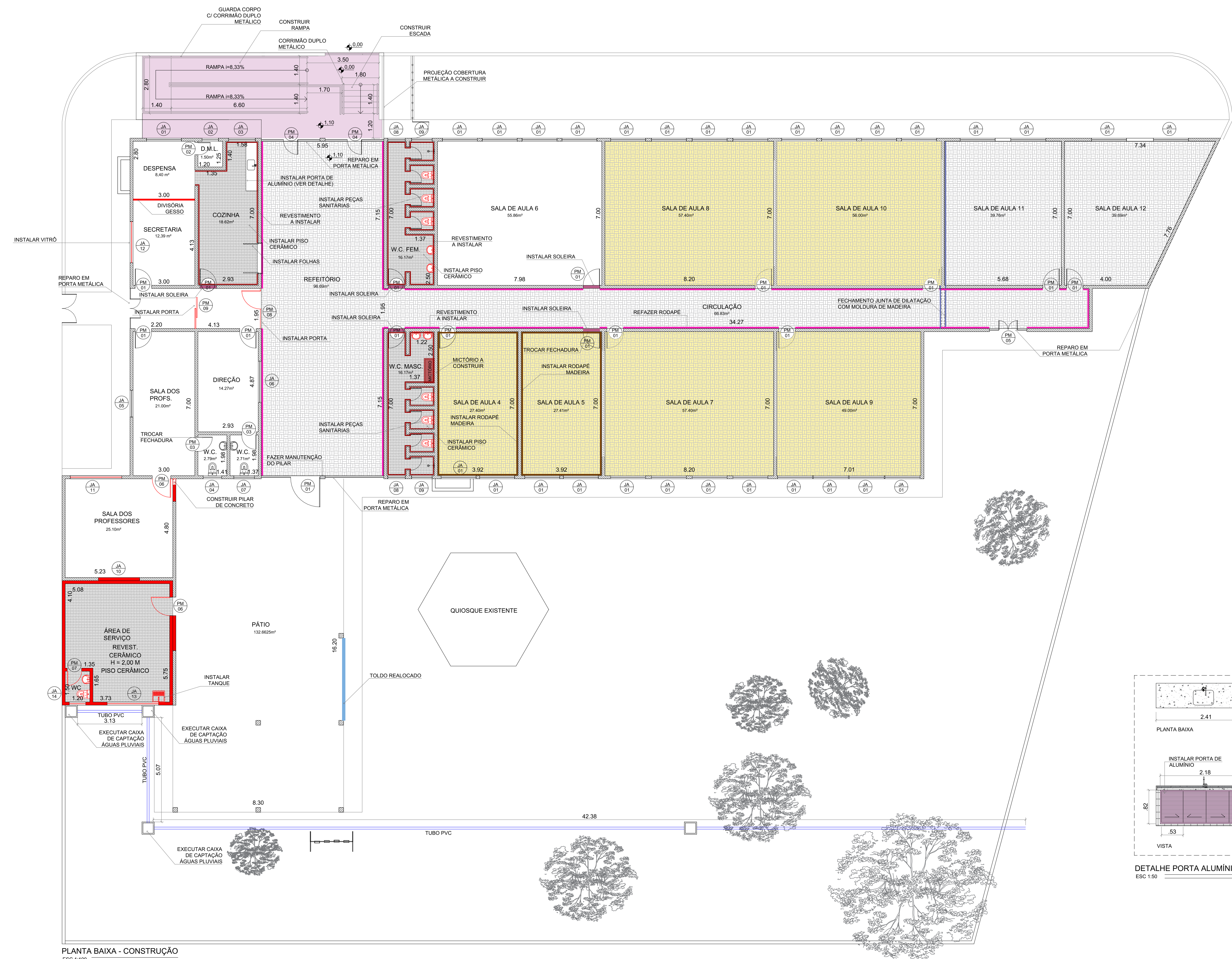
PLANTA BAIXA - CONSTRUÇÃO ESC 1:100